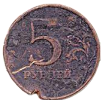
Имеющие следы воздействия высоких температур и агрессивных сред (оплавленные, травленные, изменившие цвет)