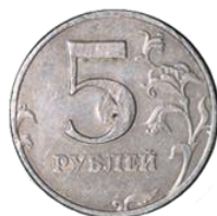
Имеющие мелкие механические повреждения, но сохранившие первоначальную форму