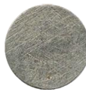
Монета, полностью утратившая изображение