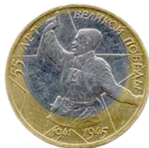
Имеющие признаки производственного брака