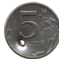
Имеющие изменения первоначальной формы (погнутые, сплюснутые, надпиленные, имеющие отверстия и следы удаления металла)