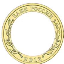
Отдельные части монеты, имеющей конструкцию «диск в кольце»